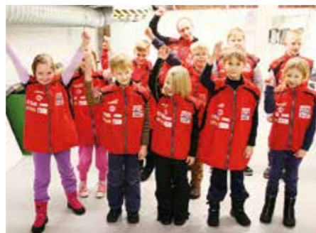
Etelä-Karjalan urheilugaalassa Hahlo sai tunnustusta Rautjärven vuoden 2014 liikuttajana. Kuvassa seuran junioreita.

Hahlon ulkoampumarata valmistui paperitehtaiden toimesta 1969. Nykyisin sen pistooli- ja pienoiskiväärirata on vuokrasopimuksella Hahlon käytössä. Seuran kotisivuilla todetaan, että ”ratojen kunto on korkeintaan tyydyttävä”.