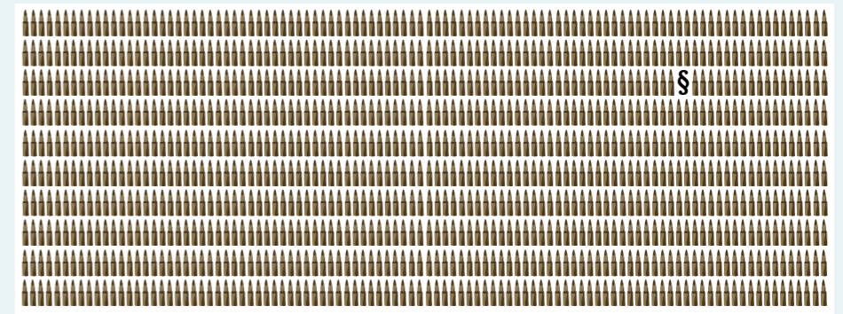
Tässä näkyy 1 000 luotia. "Vähäisten ampumaratojen" vuosittainen laukausmäärä saa olla maksimissaan kymmenkertainen.

Lausunnon valmisteluun ovat osallistuneet toimisto, liittohallitus ja Ampumaharrastusfoorumin muut järjestöt sekä lisäksi asiantuntija-