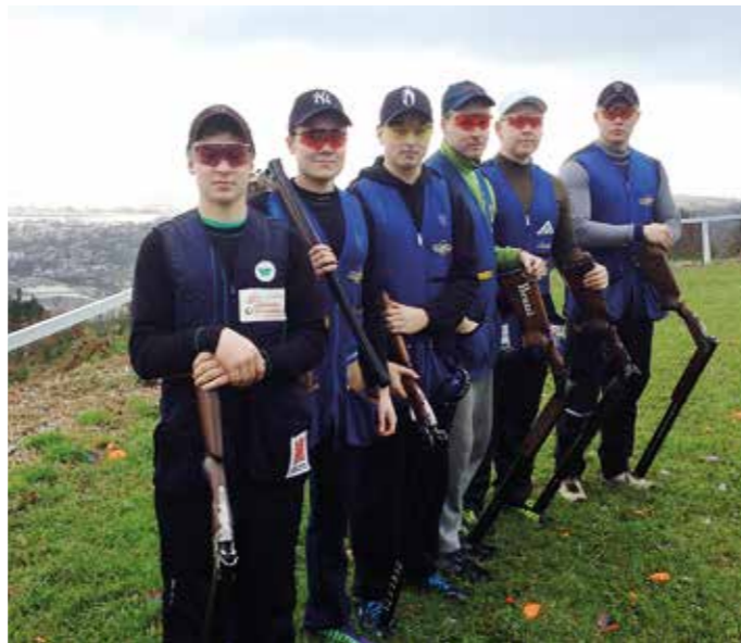
Skeet-ampujat saivat Espanjan Irunissa järjestetystä harjoitusleiristä oivan aloituksen kaudelle.