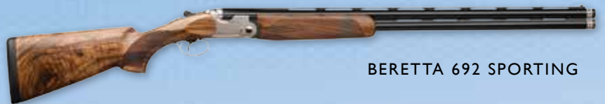
BERETTA 692 SPORTING