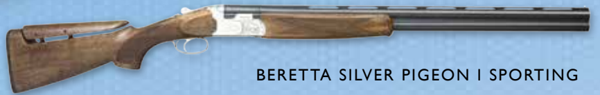
BERETTA SILVER PIGEON I SPORTING