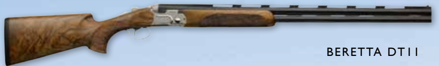
BERETTA DT 11