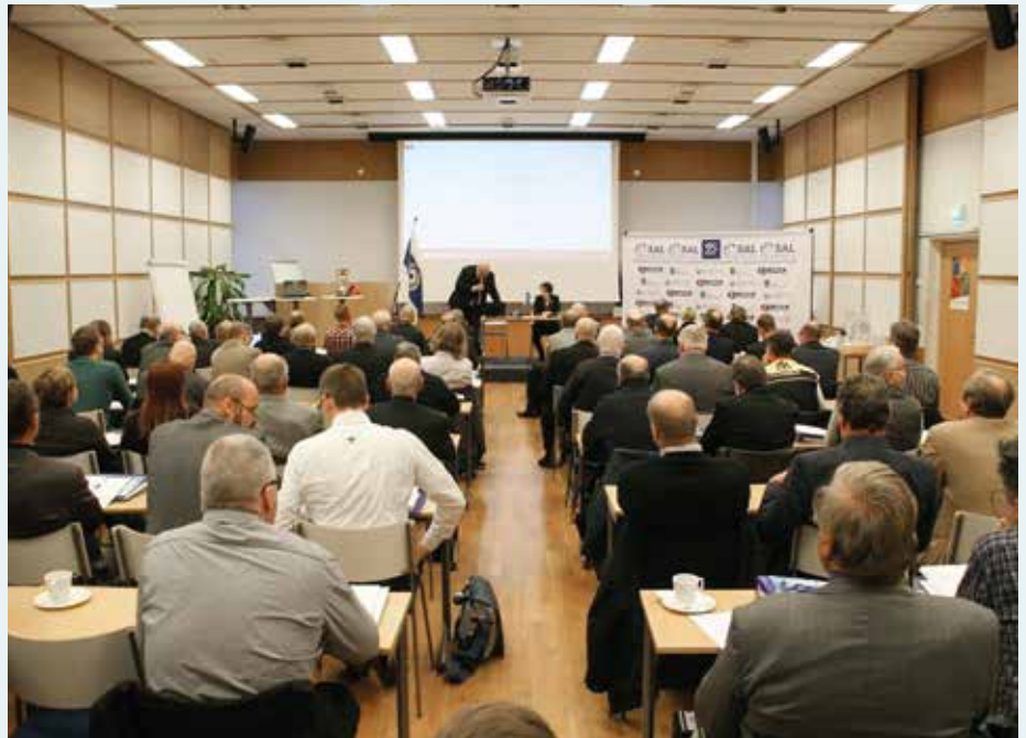
Ampumaurheiluliiton syksyn kokoukset pidettiin vuonna 2014 Valo-talolla.

– Kykyä viestiä vakuuttavasti ja käyttää