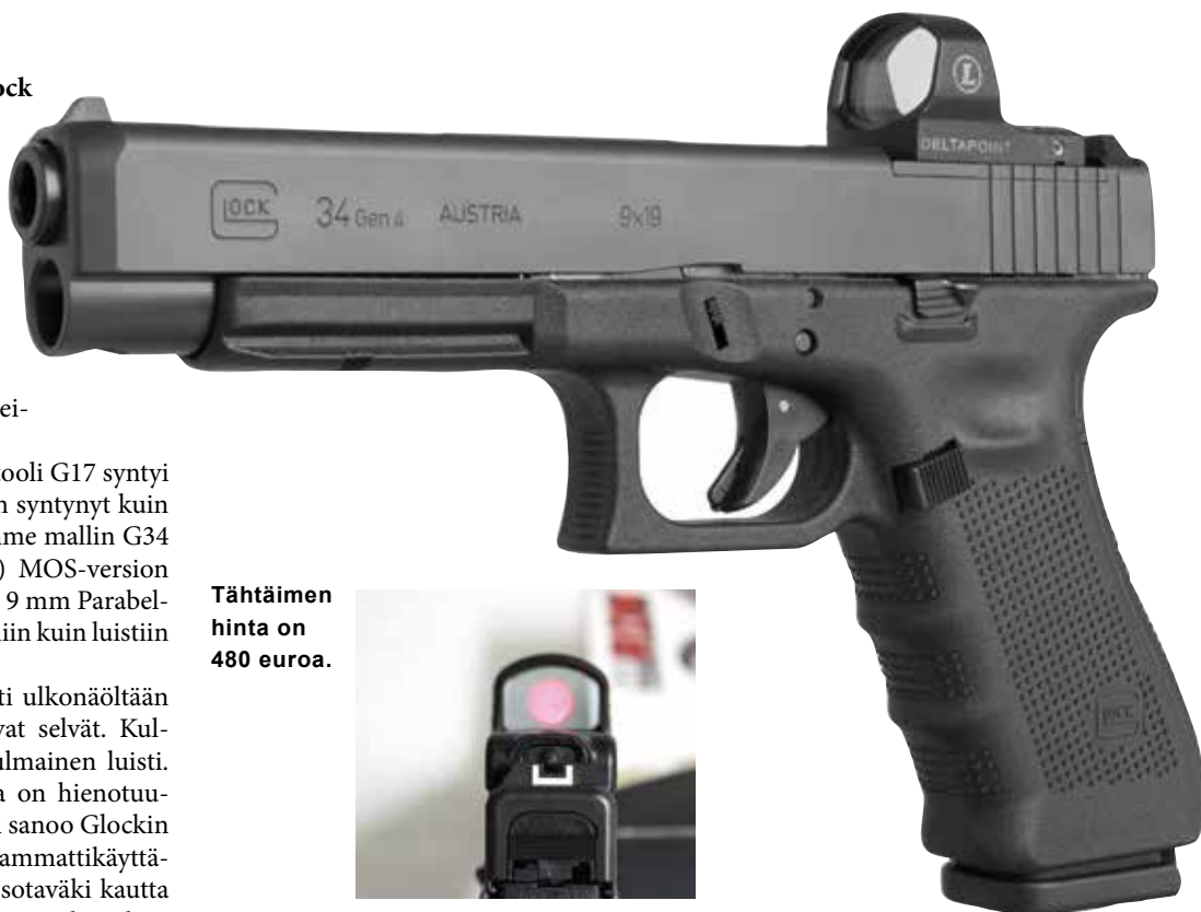
Tähtäimen hinta on 480 euroa.

GEN4:N UUSIA piirteitä ovat muun muassa kahva, johon voidaan liittää erikokoisia takapaloja, kaksi luistijousta sekä suurennettu