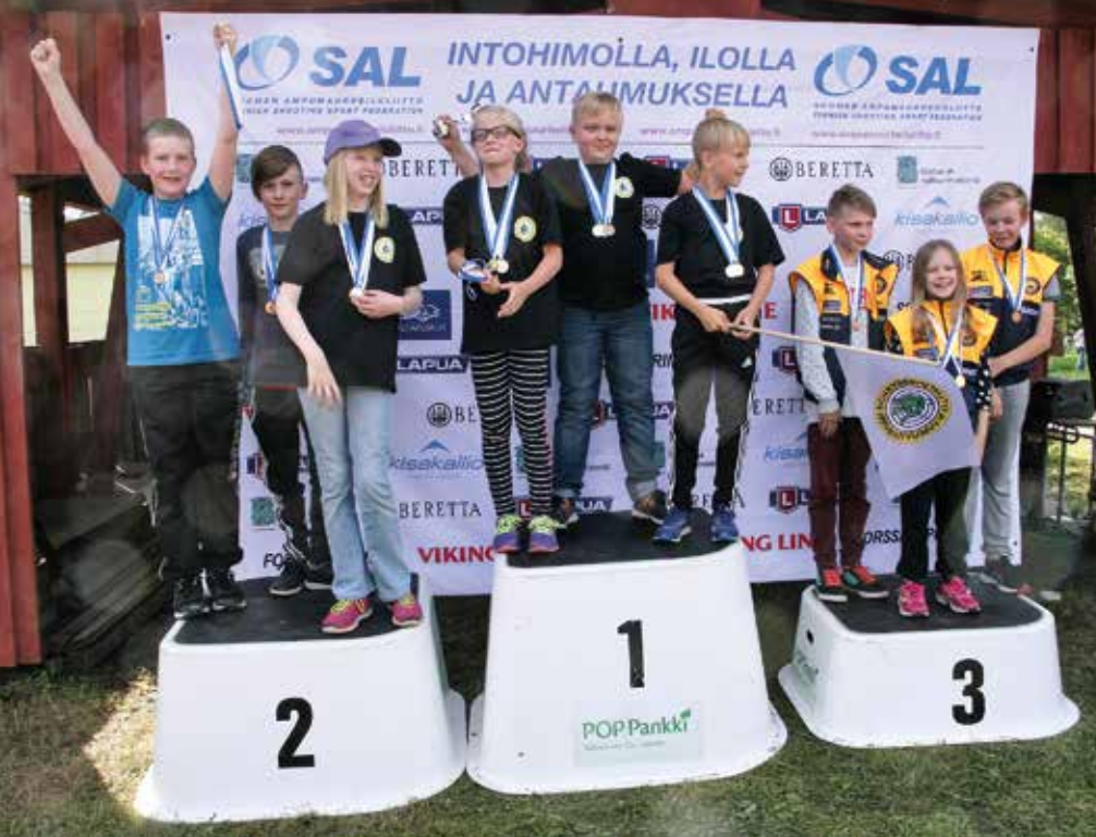
Isonkyrön Metsästys- ja Ampumaseura oli jälleen vahvalla sakilla liikkeellä, mikä näkyi myös menestyksenä joukkuekilpailuissa.