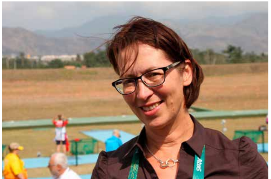
Kansainväliseen olympiakomiteaan elokuussa valittu Sari Essayah seurasi suomalaisampujien suorituksia Rioissa.