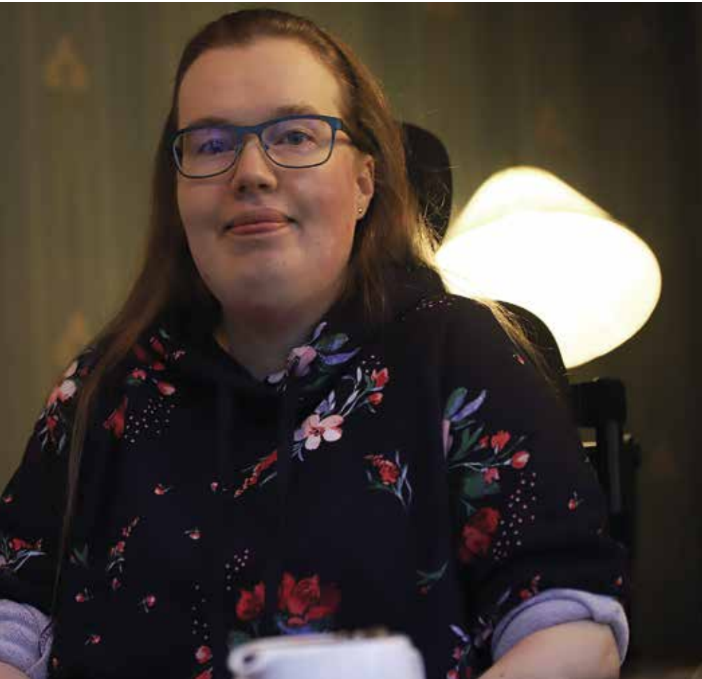
oman uran jälkeenkin.