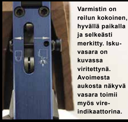
Varmistin on reilun kokoinen, hyvällä paikalla ja selkeästi merkitty. Iskuvasara on kuvassa viritettynä. Avoimesta aukosta näkyvä vasara toimii myös vireindikaattorina.