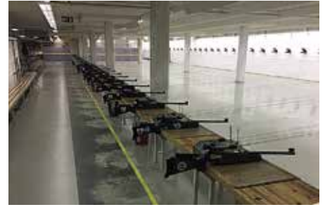
OMAS:n radalla Oulussa kaikki valmiina koululaisvierailuun.