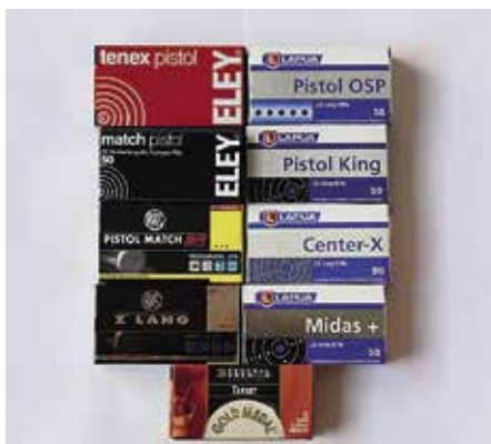
MG2 koeammuttiin useanmerkkisillä patruunoilla.

TURVALANGAN PAIKOILLEEN laitto ei ollut niin näppärää. Varsinkin kisoissa tuomarit ovat aika nopeita "Patruunat pois ja tauluil-