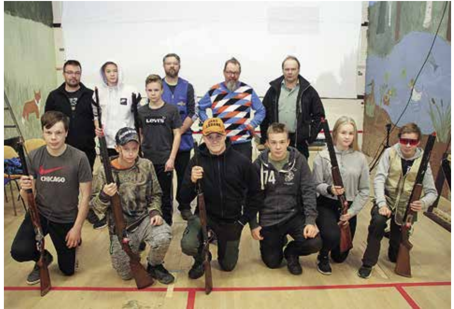
TorSA:n haulikkoampujia ryhmäkuvassa.

Vuoden 2013 vuosikirjan mukaan Lapin alueella oli yhdeksäntoista ampumaseuraa, joissa oli jäseniä yhteensä 852. Nyt seuroja on kolmeitoista ja yhteinen jäsenmäärä on noin 800.