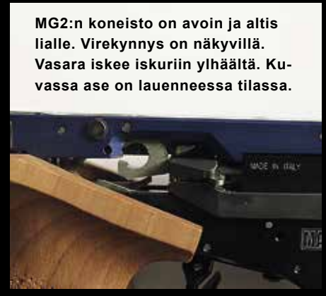
MG2:n koneisto on avoin ja altis lialle. Virekynnys on näkyvillä. Vasara iskee iskuriin ylhäältä. Kuvassa ase on lauenneessa tilassa.