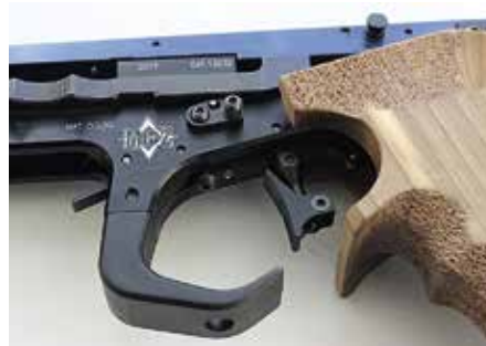
Kuvassa näkyvät vasemmalta viritysviiste (raskaskäyttöinen!), putkilippaan salpa, luistin takanapitosalpa, liipaisin ja sen kaari sekä Matchgunsin suunnittelema ja valmistama kahva.

gisin symbolein merkitty. Luistin takanapitosalpa on vasemmallalla kyljellä ja hieman hankalampi käyttää, johtuen pitkälti jäykästä luistijouksesta.