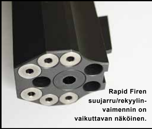
Rapid Firen suujarru/rekyylivaimennin on vaikuttavan näköinen.