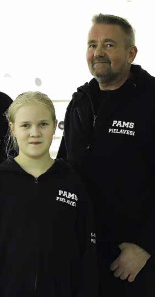
iloisia PAMS:n hyvähenkisestä ja aktiivisesta