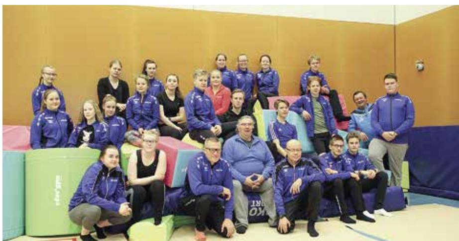
Ampumaurheiluliiton tehoryhmän fysiikkaleirin osanottajat ryhmäkuvassa Lohjalla Kisakallion urheiluo- pistossa.

Nurmen koulutukseen kuuluivat klassi- nen baletti-, jazz-, ja nykytanssi, kärkitossutekniikka sekä teatteri- ja karakteritanssi. Opintoihin kuului myös anatomian, ravinnon, kehonhuollon ja ensiavun luentoja sekä tenttejä. Myös tiiviskurssit, teosanalyysin