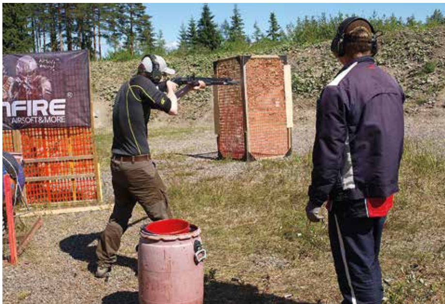
Tänä vuonna practicalin valmennus on ottamassa harppauksia eteenpäin.

VAILLINAISESTA valmennuspanostuksesta huolimatta Suomi on tähän asti ollut maailman ehdotonta huippua practicalin pitkien aseiden lajeissa, mutta odotettavissa on että maailmalla taso sekä kovenee että levenee, joten perinteiset kotikutoiset