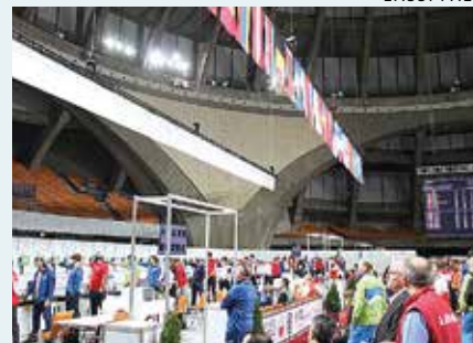
Miesten ilmapistoolikisa käynnissä Wroclawin EM-radalla.

Wroclawin EM-kilpailut olivat järjestyksessään 50. ilma-aseiden EM-kilpailut, ja niihin osallistui noin 600 urheilijaa 45 maasta. Kisoissa oli jaossa EM-mitalien lisäksi kahdeksan maapaikkaa Tokion olympialaisiin.