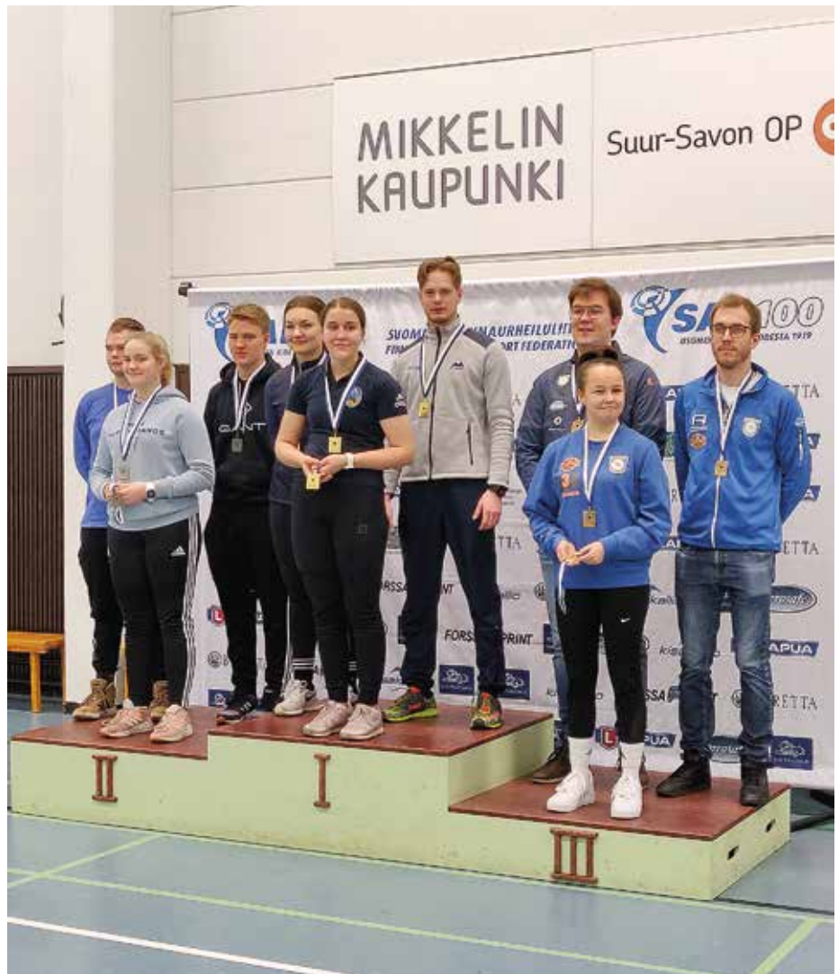
SFS-lagen väl representerade på prispallen under lag FM.

Det här innebar att RS knep bronset med endast en 0,6 poängs marginal till fyran Piekasamäen Seudun Ampujat, dessutom var femman Haminan Ampumaseura endast 0,7 poäng efter RS. Före de sista skyttarna