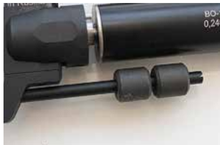
Tankoon voi kiinnittää painoja 0–4 kappaletta.

keästi lähes 180°. T-asennossa ilmaa ei kulu eikä luoti lähde, mutta ase on manuaalisesti viritettävä joka laukausta varten. Lievästi