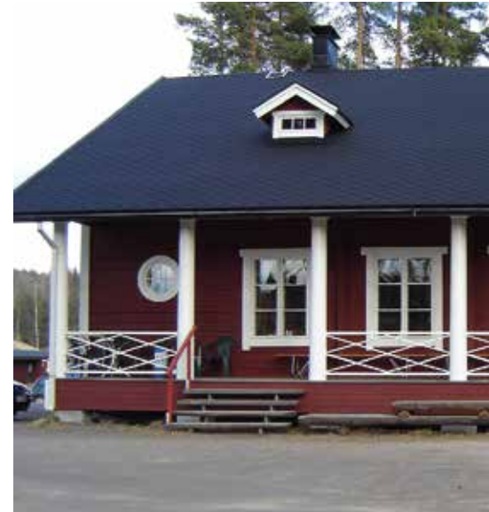
Mikkelin Ampujien Kyrönpirtti.

Kilpailutoiminnasta sen verran, kun liitto hyväksyy ns. näyttökilpailuja, niin niitä ei saisi pitää viikolla eikä kytkä mihinkään hotelli-