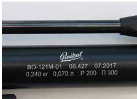
Baikalin paineilmasäiliö noudattaa Steyrin standardia.

Varsinaista varmistinta ei ole, mutta ikealla sivulla on kuivalaukauskyskin. Asennot T (training, trocken) ja F (fire, feuer) on selvästi merkitty ja kytkin pyörähtää sel-