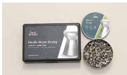
Koemunnoissa kokeiltiin myös lyijyttömiä H&N Match Green -luoteja. Materiaali on enimmäkseen tinaa.

AMMUIN KOLMEA erilaista luotia aseella: H&N Finale Maxx Heavy (0,53 g), RWS R10