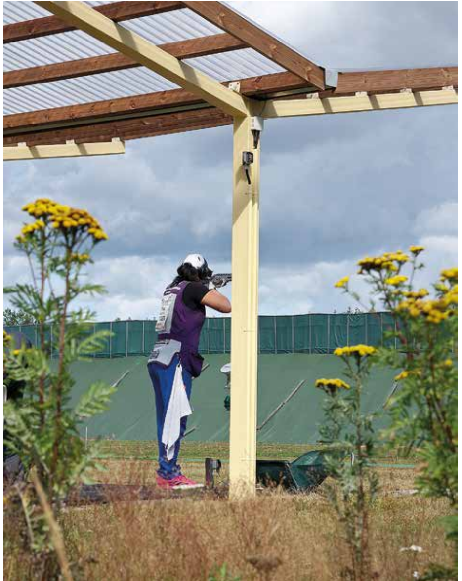
Hälvälän radalla ammuttiin viime vuoden elokuussa haulikkolajien maailmancup.

– Jos tiettyjä harjoitteita suoritetaan, se