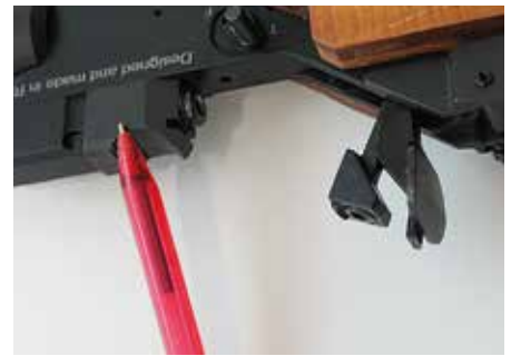
Kynä osoittaa avaussalpa, joka on hieinan raskaskäyttöinen.

keästi lähes 180°. T-asennossa ilmaa ei kulu eikä luoti lähde, mutta ase on manuaalisesti viritettävä joka laukausta varten. Lievästi