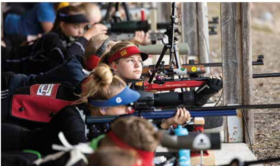
Monipuoliset ampumaradat eri puolilla Suomea ovat tärkeitä ampumaharrastajille ja uusien harrastajien houkuttelemiseksi. Kuvissa kivääriampujia Salossa ja nuoria pistooliampujia Isossakyrössä.

kotirata Hälvälä. Vaikka maailmalla monet ulkoradoista sijaitsevat hyvinkin asutuksen tuntumassa, on Hälvälä Suomessa yksi harvoista asutusalueen tuntumassa sijaitsevista. Asutusalueen läheisyys tuo helpommin valituksia melusta, joiden käsittely kestää.