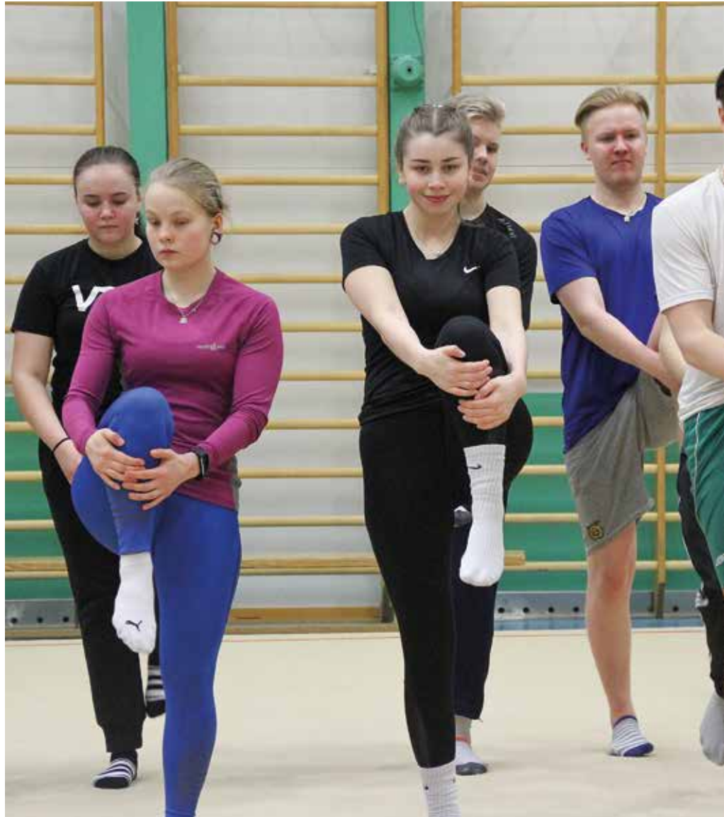
Ampumaurheiluliiton tehoryhmän fysiikkaleiri järjestettiin nyt toisen kerran.

HARJOITTELUN LISÄKSI leireillä on luentoja, harjoittelun ja tekniikoiden analysointia sekä henkilökohtaisia keskusteluja.