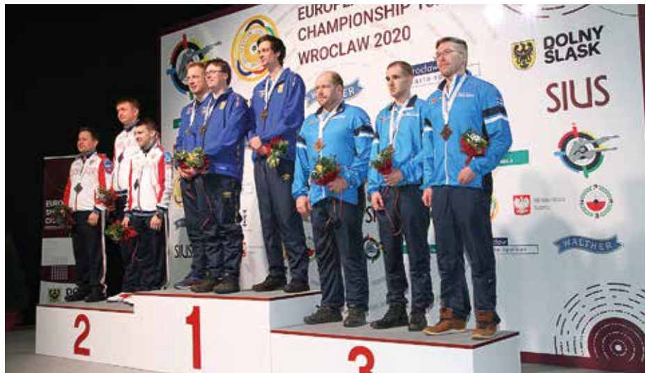
Suomen miehet saivat kaksi EM-joukkuepronssia.