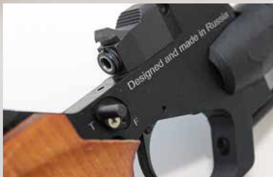
Luoti asetetaan pesään sorminäppäryydellä ilman apuneuvoja.

Säiliössä on kellomittari, jonka yksiköt ovat megapascalita (MPa). 20 MPa vastaa 200 baria, joten kummoistakaan päässälas-kutaitoa ei tarvita. Vihreä asteikko on 7–20 MPa.