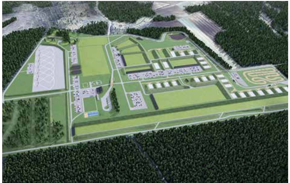
Ruutikankaan ampumaurheilukeskuksesta tulee eräs Euroopan suurimmista, joten kivääripracticalin MM-kilpailuiden pitopaikaksi se sopii erinomaisesti.

MM-kisan valmistelutyö on jo hyvässä vauhdissa. Parhaillaan SAL:n hallitus, IPSC-jaosto ja Aro työstävät järjestämispöytäkirjaa. Keväällä aloitetaan keskustelut