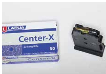
Yksirivinen lipas on tyypillinen 22 LR kiväärille.

ČZ 457 on siro, kevyt ja kompakti kivääri. Se on Suomen aselain nimissä pienoiskivääri, mikä pitää muistaa aselupaa haettaessa. Että