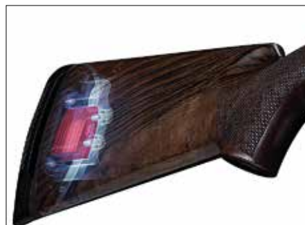
Benellin perässä on nippu teräspainoja (punaiset), joilla säädellään haulikon tasapainoisuutta.

Irrottaminen ja kiinnittäminen vaativat noin kymmenen kierrosta, mikä kielii ta-