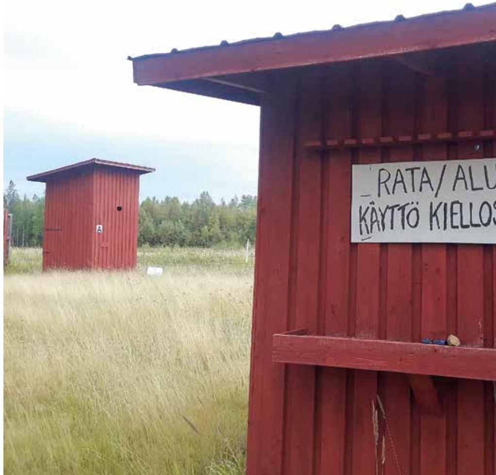
Huonosti mennyt ympäristölupaprosessi saattaa pahimmillaan johtaa koko radan tai yksittäisen

Tällainen tilanne johtuu miltei aina siitä, että lupahakemus on laadittu ilman erityisasiantuntemusta, eikä potentiaalisia ympäristövaikutuksia ole hakemusvaiheessa arvioitu riittävästi.