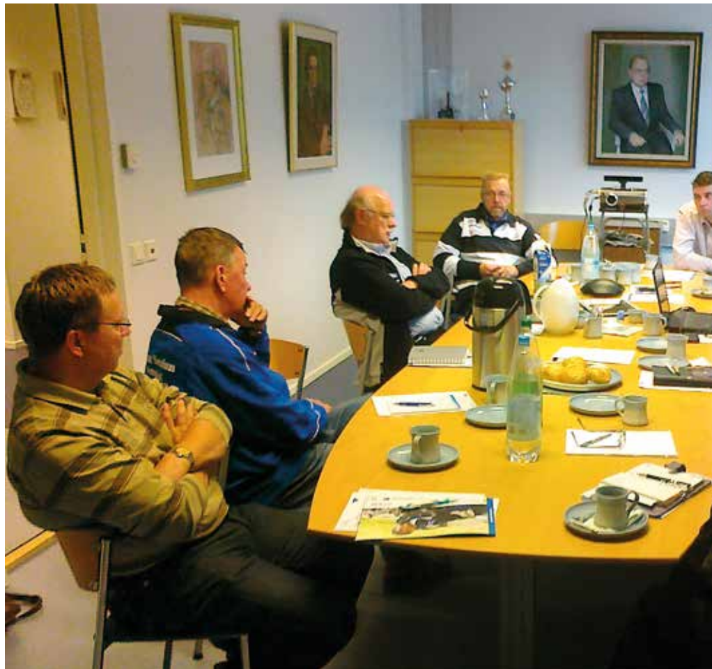
Turun Seudun Ampujien seurakehitysprosessi käynnissä syksyllä 2012.

TOIVON MUKAAN tämän vuoden aikana päästään koulutuksienkin ja muiden tapaamisten myötä jakamaan hyviä käytäntöjä ja toimintatapoja sekä kehittämään entisestään loistavaa harrastusta, lajejanne ja seurojanne. Suosittelen lämpimästi lähtemään mu-