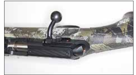
Lukkokammen takana näkyy varmistin hyvällä paikalla. Lukon päätykappaleessa näkyy punainen vireindikaattori.