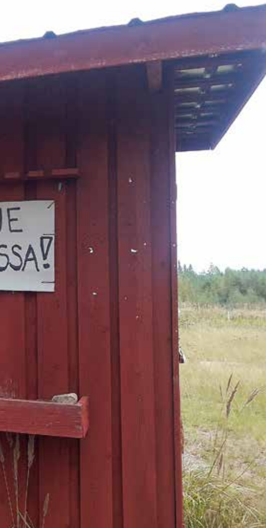
n lajiradan sulkeutumiseen.

2017. Kuopion kaupungin ympäristö- ja rakennuslautakunta myönsi toiminnalle luvan vuonna 2018, mutta se ei saanut lainvoimaa, sillä usea taho valitti päätöksestä Vaasan hallinto-oikeuteen.