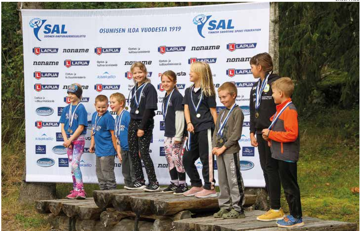
Ruutilajien Kultahippufinaalit ammuttiin Iossakyrössä elokuussa.