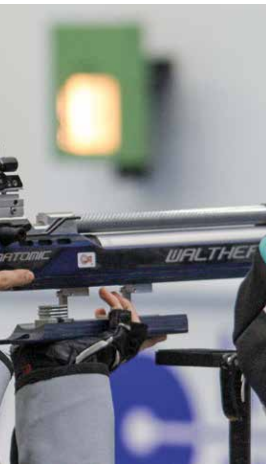
käytiin joulukuussa Kisakallion urheiluopistossa.

neljä pistettä. Yksi askel eteenpäin on se, että olen juuri nyt tilaamassa uutta ”piekkaria”, jonka saan ehkä helmikuussa. Kalusto on kunnossa, sillä olen ampunut nykyisellä ilmakiväärilläni vasta vajaan vuoden ajan. Hankin uuden puvun myös viime vuonna. Kaikki on mennyt siis vaihtoon – paitsi äijä itse!