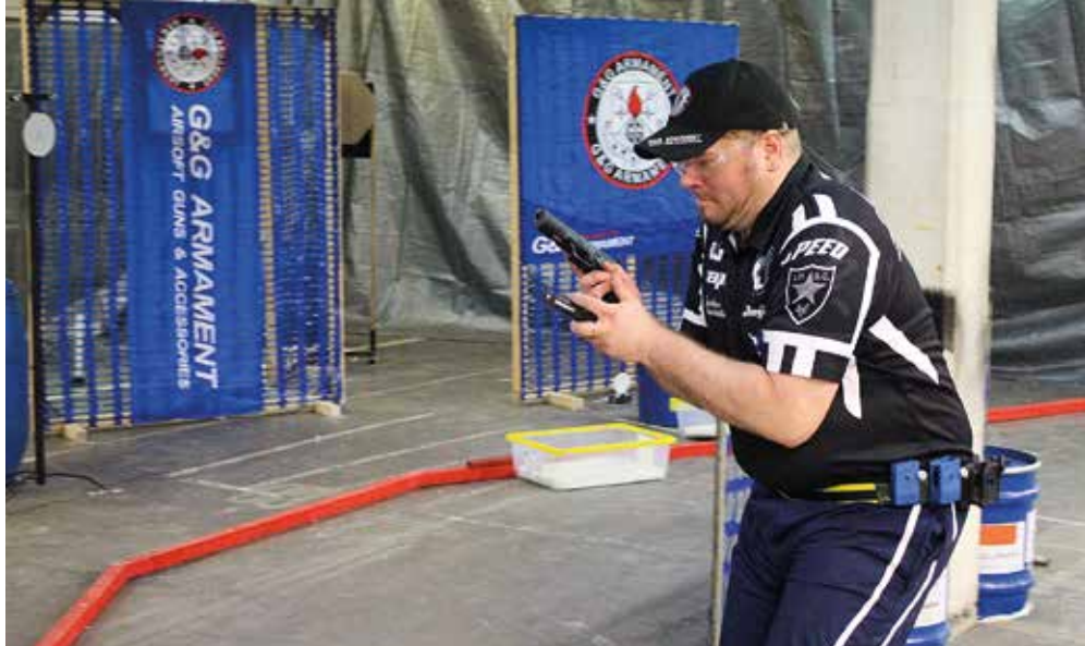
Practical esittäytyy Salon SM-viikolla vauhdikkaan practical-ilmapistoolin muodossa.