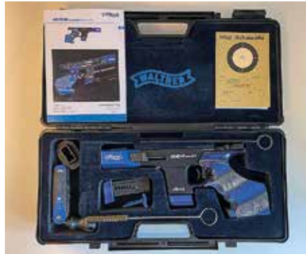
Walther GSP 500 toimitetaan kuvan mukaisessa salkussa.

Pehmusetusta muovilaukusta löytyvät puhdistuspuikko, pronssihaarja, tasapäinen lyhyt ruuvimeisseli, monitoimityökalu, kaksi lipasta, lipastamisen avustin, koeammuntataulu, muovipala kuivalaukaisuja varten ja monipuolinen ohjekirja (DE, EN, ES, FR).