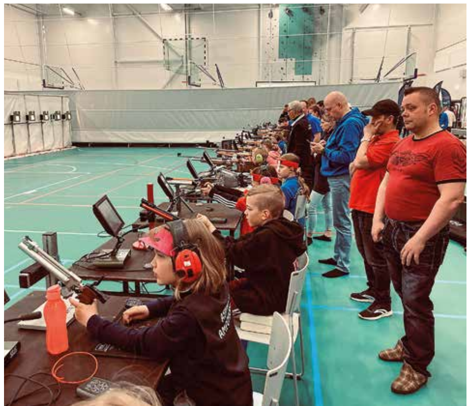
Ilma-aseiden Kultahippufinaalit järjestettiin vappuaattona Kauhavalla.