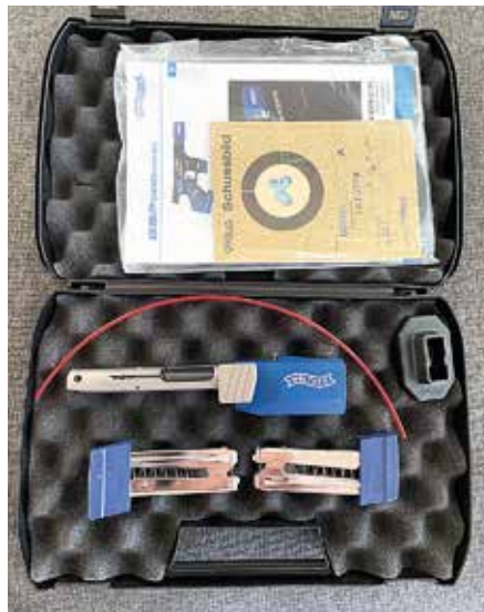
32 S&W Long vaihtosarja.

Monivärisen ohjekirjaan on panostettu, sillä aseiden säätäminen (kahva, tähtäimet, laukaisu), huolto, ja varoitukset ovat selkeästi kerrottu ja myös visualisoitu kuvien kera.