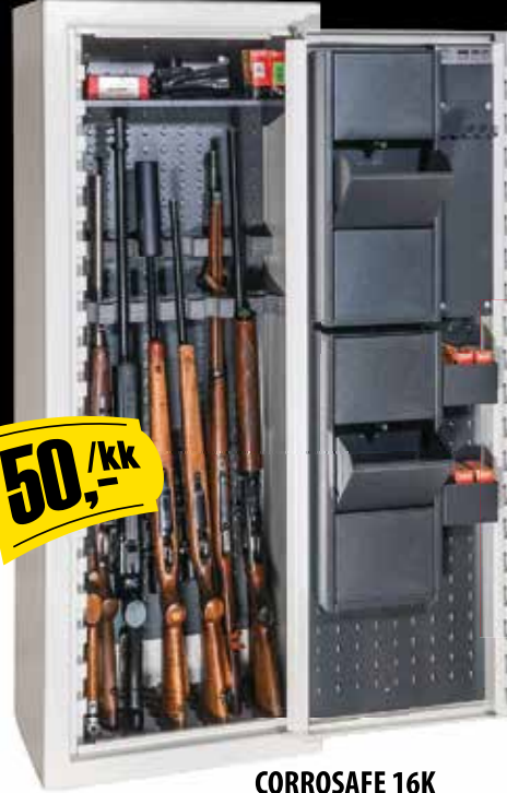
CORROSAFE 16K Kuvan kaappi lisävarustein.