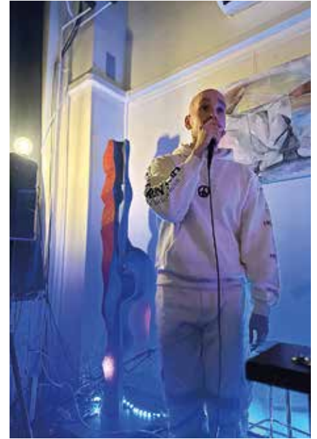
Jäniksen ensimmäinen keikka oli Tampereen Rainassa helmikuun alussa.

– Ekasta esiintymisestä pitää saada koherentti kokonaisuus, mutta hetken inspiraatioillekin pitää jättää tilaa.