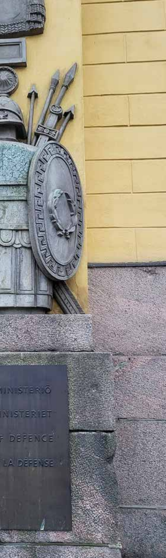
paikka myös Ampumaurheiluliiton väelle.

kymmenet ympäristöministeriön toimialalla eivät ole olleet helppoja.