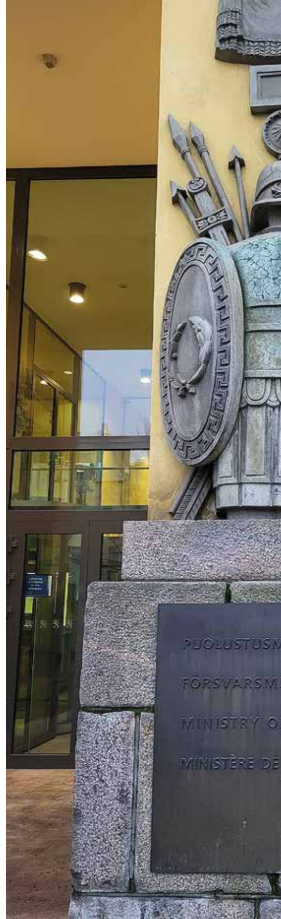
Helsingissä sijaitseva Puolustusministeriö on tuttu

lisesti paljon ja tulkinta sen mukaista.