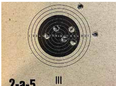
Tästä kaikki alkoi: ensimmäiset laukaukset pystyasennosta syksyllä 2021.