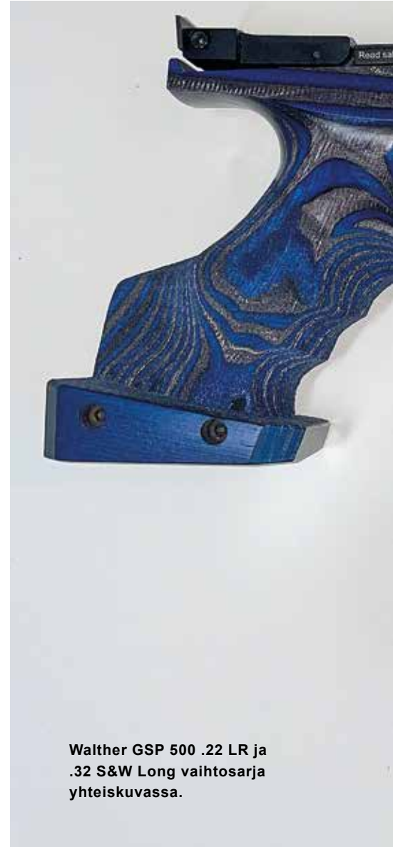
Walther GSP 500 .22 LR ja .32 S&W Long vaihtosarja yhteiskuvassa.

Takatahtäin on irrotettavissa sivussa olevan ruuvin avulla esimerkiksi huoltoa var-