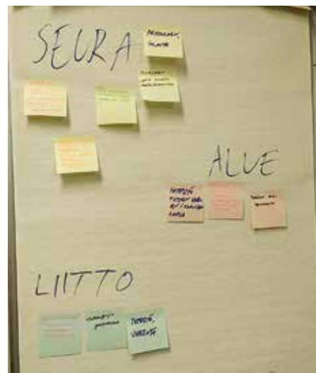
Nuorten mielestä muun muassa yhteistyö seurojen ja eri ampumaurheilulajien kesken koettiin tärkeäksi.

ALUEELLISESTI ampumaurheilua voi kehittää tiedottamalla ja tuomalla harrastusta esille paremmin muun muassa yhteistyössä